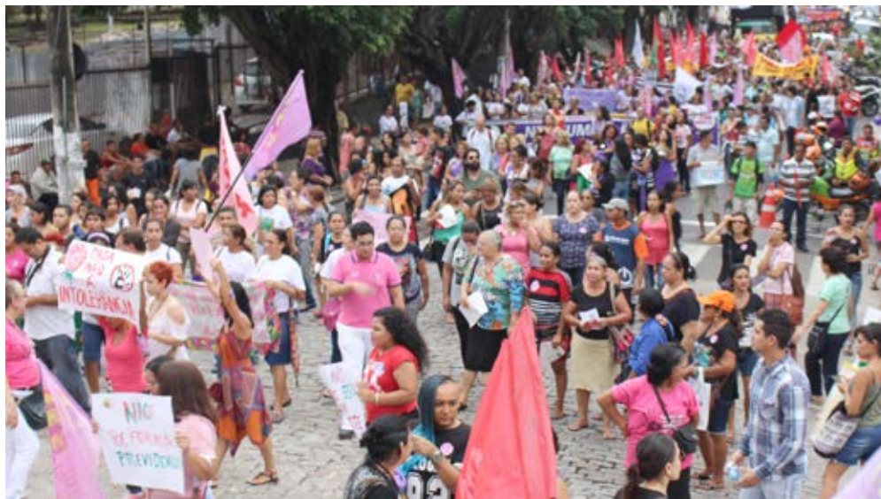
Milhares de manifestantes, sobretudo mulheres, foram às ruas no mês de março protestar contra as reformas impostas

De acordo com a presidente da Comissão de Direito Previdenciário da Ordem dos Ad-