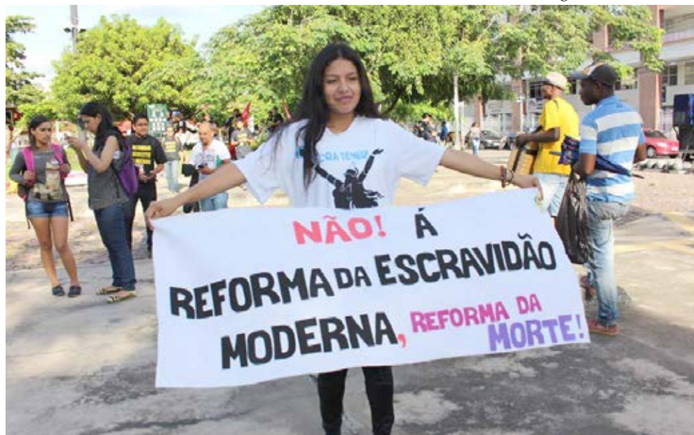
Ninguém trabalha hoje com a perspectiva de não poder aposentar-se amanhã: as ruas dizem não à “PEC da morte”