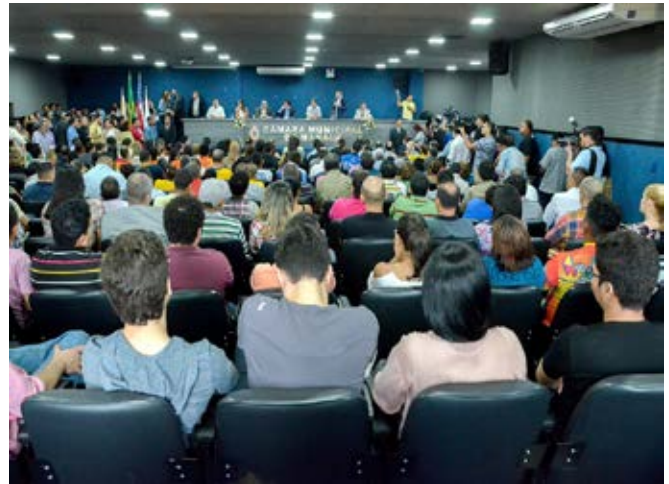
Classe artística pressionou por décadas pela aprovação do dispositivo